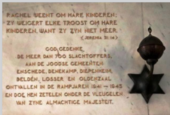
Tekst boven de ingang van de Grote Sjoel van de Synagoge te Enschede.